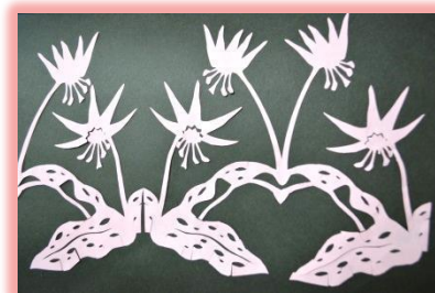
切り絵 デザイン今森光彦