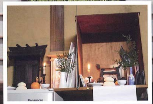
恵比寿大黒への供え物 (大晦日)