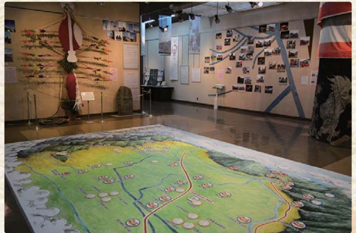
空から安曇野を見ているような絵地図

昭和30年代の安曇野市を舞台に、家々の祭り・村のオフネ祭り・道祖神祭りなど、さまざまな祭りを紹介。西日本と東日本の文化の十字路でもある安曇野の人々が作り上げてきた、長い歴史の上に成り立った深く多様な文化をご覧ください。