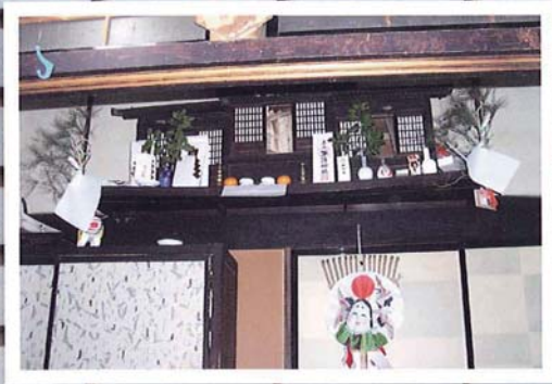
年取りの夜の神棚 (12月)