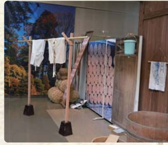
屋敷林の庭を再現