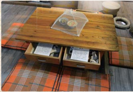
昭和30年代のくらしって？